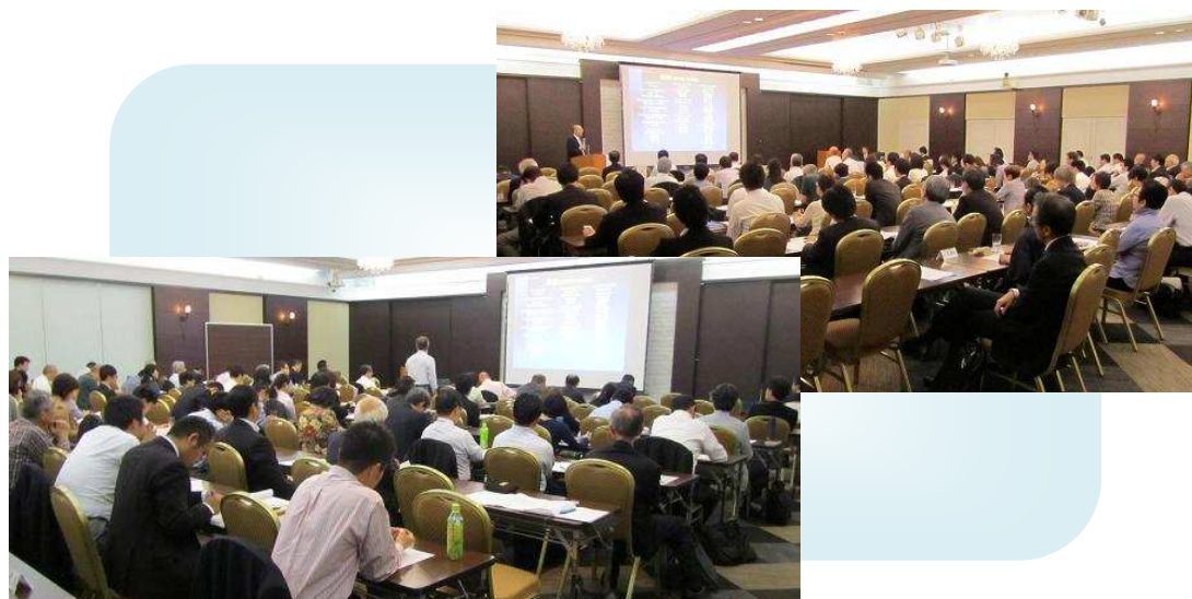
講演・質疑応答の様子